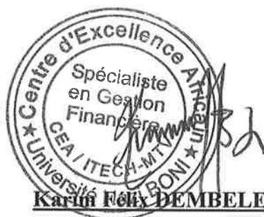
Karim Folly DEMBELE